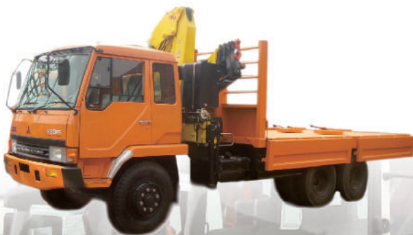
CRANE TRUCK MITSUBISHI FUSO 220PS