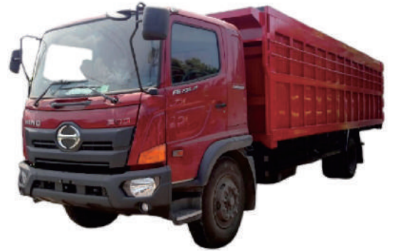
CARGO TRUCK HINO