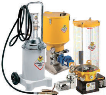
LUBRICATION GREASE PUMP