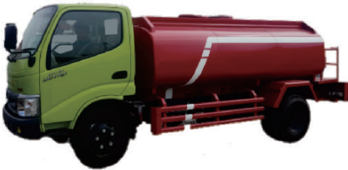
WATER TANK TRUCK HINO 130D