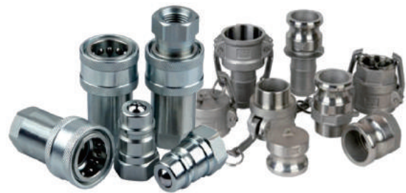
QUICK RELEASE COUPLING