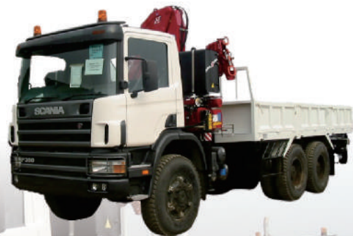
CRANE TRUCK SCANIA P360