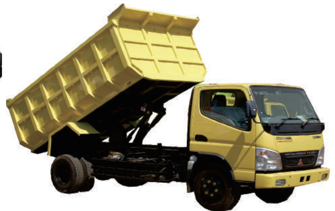
TIPPING TRUCK MITSUBISHI COLT PS