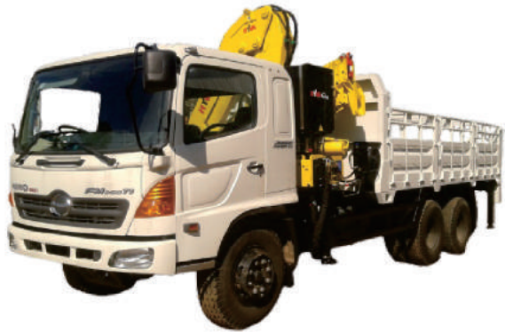
CRANE TRUCK HINO 250