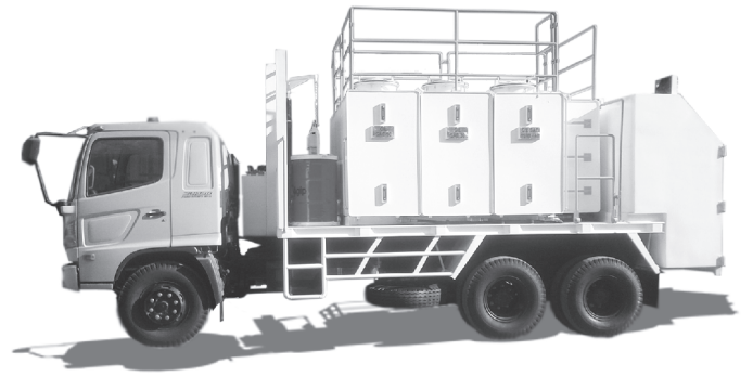
OIL TRUCK MITSUBISHI 220PS