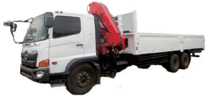
CRANE TRUCK HINO