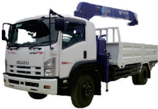
CRANE TRUCK ISUZU FTR 210PS