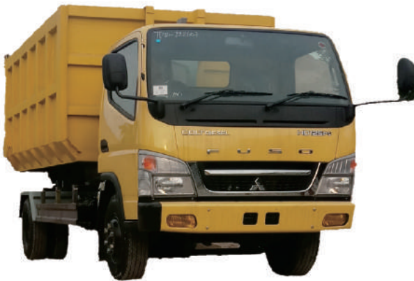
HOOKLIFT TRUCK MITSHUBISHI FUSO