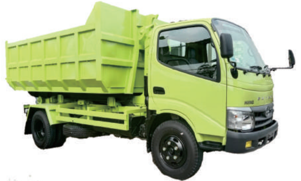
HOOKLIFT TRUCK HINO DUTRO 130 D