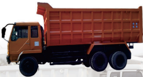
DUMP TRUCK MITSUBISHI