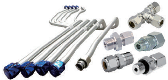
HYDRAULIC TUBE & ADAPTER