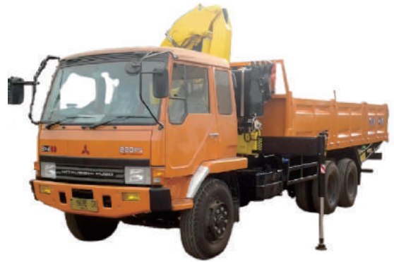
CRANE TRUCK MITSUBISHI 220PS