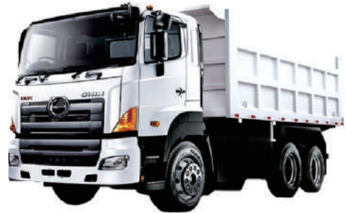
DUMP TRUK HINO