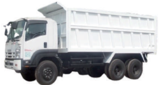
DUMP TRUCK ISUZU