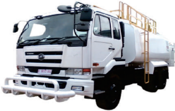
FUEL TRUCK UD