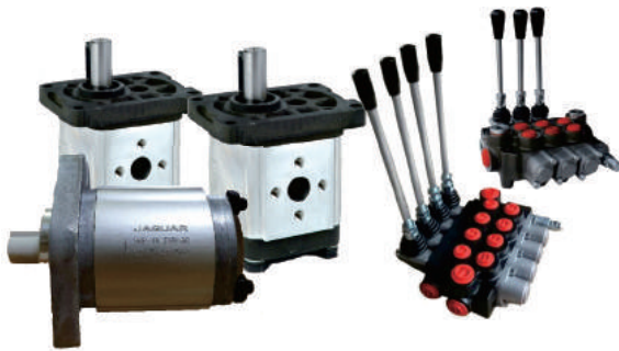
HYDRAULIC MOTOR & CONTROL VALVE