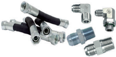
HYDRAULIC HOSE ASSEMBLY DAN ADAPTER