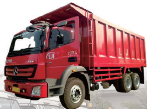
DUMP TRUCK MERCY AXOR L200