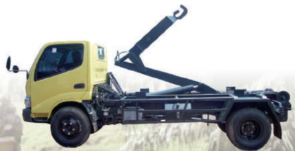
ARM ROLL TRUCK