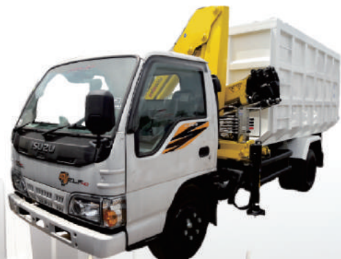
CRANE TRUCK ISUZU