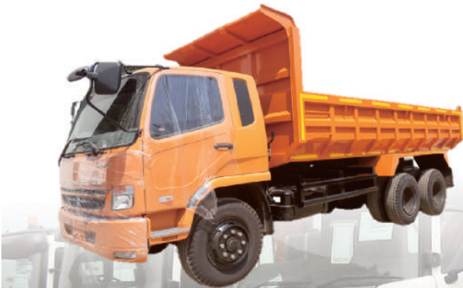
CARGO TRUCK MITSUBISHI 220PS