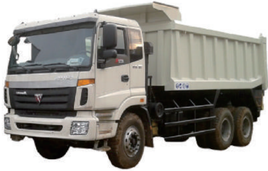
DUMP TRUCK POTON