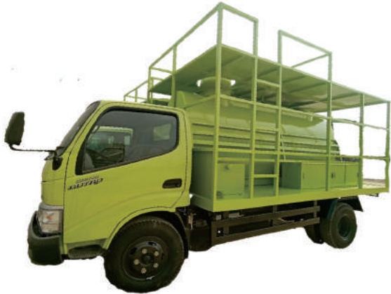
TUS TANKI TRUCK HINO DUTRO 130 D