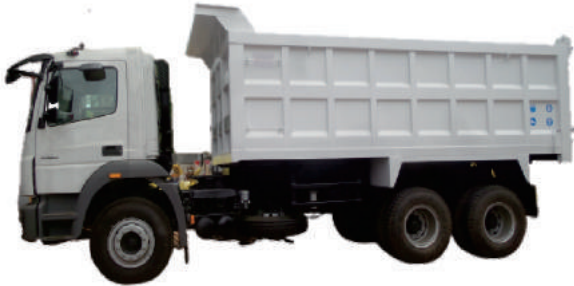
DUMP TRUCK MERCY